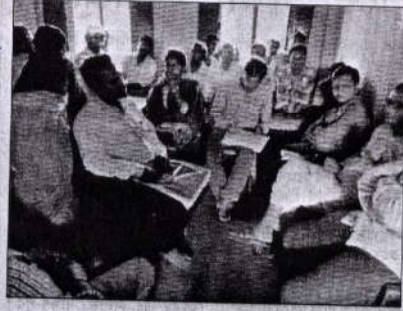
স্কুল কর্তৃপক্ষের সঙ্গে বৈঠক করছেন বিডিও।

অভিযোগ। এমনকী, বেজায় নাটনিকে স্কুল থেকে ছাড়িয়ে নিয়ে যাচ্ছি বলে নকুলবাবুর কাছ থেকে এক মুচলেকাও আদায় করে নেয় চৌপেন্যা স্কুল। এর পর দাদু নাটনিকে চরখি শিশুশিক্ষা কেন্দ্রে নিয়ে আসেন। কিন্তু সেখানেও বাবা-মায়ের এডসের কাহিনি শুনে