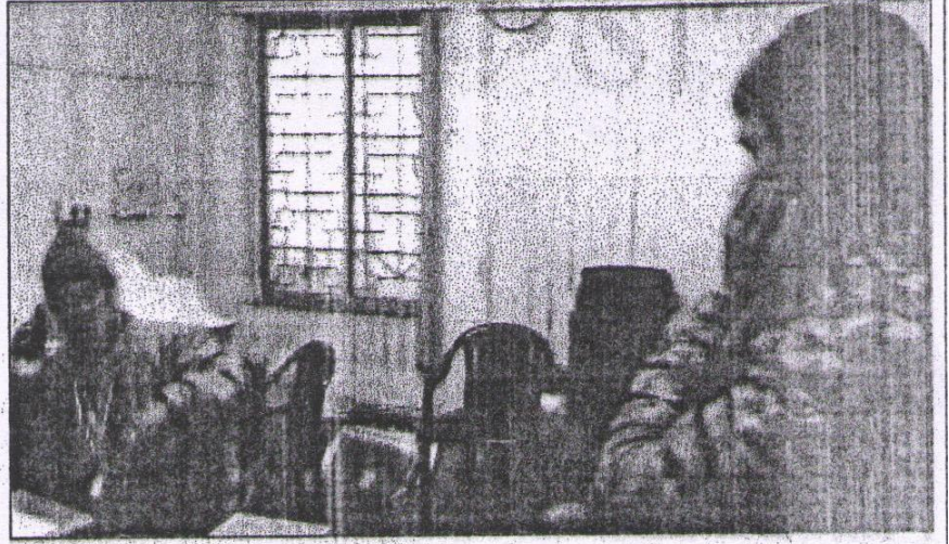
■ কান ধরে ওঠবস করানো হচ্ছে মালদহের যুবককে।